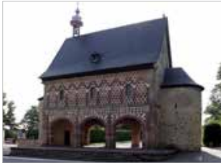
Abb. 1 Königshalle des Klosters Lorsch

Das Benediktinerkloster Lorsch wurde im Jahre 764 n. Chr. gegründet und mit Mönchen aus der Abtei Gorze (bei Metz) besiedelt. Die erste Kirche konnte aber erst nach der Trockenlegung des Sumpfgebietes an der Weschnitz errichtet werden. Auf die Bitte von Chrodegang (Erzbischof von Metz) schenkte Papst Paul I. dem Kloster die Reliquien des heiligen Nazarius, die am 11. Juli 765 eintrafen. Nazarius war ein zum Christentum übergetretener römischer Soldat, der um das Jahr 304 gemeinsam mit seinem